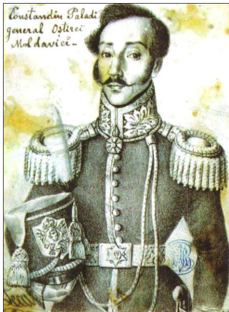
Fig. 4. Hatmanul Constantin Paladi-Bogdan (litografie a pictorului Constantin Lecca, 1831).

Sursa: BAR, AD I 13/13; schiță într-un caiet de desen, 23 × 17,3 cm.